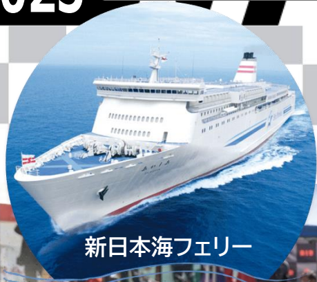
新日本海フェリー