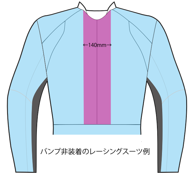
パンプ非装着のレーシングスーツ例